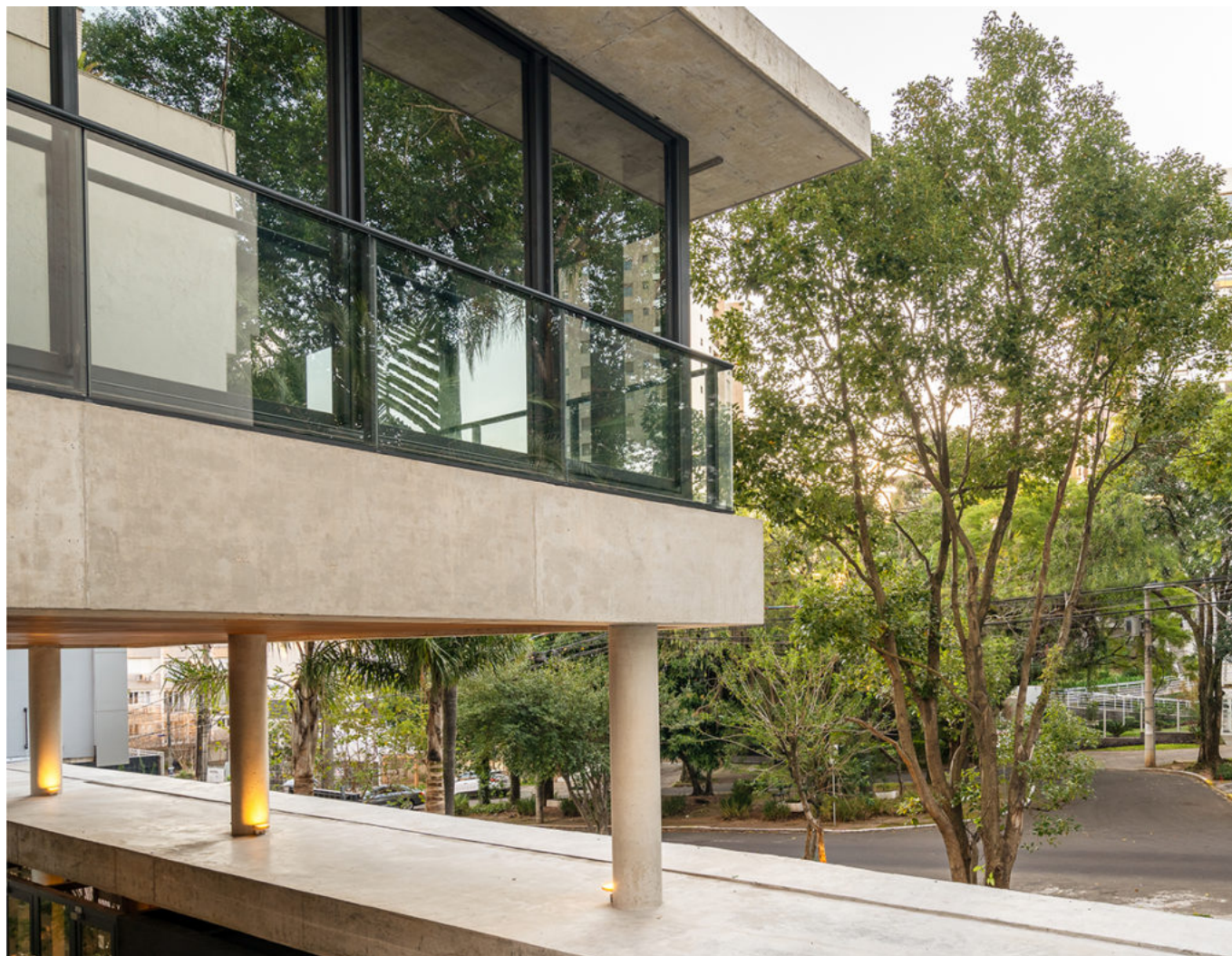
Os vazios e recuos do embasamento configuram generoso espaço aberto dentro do empreendimento. Na foto, vê-se a projeção do apartamento sobre o pórtico de entrada

Trata-se do produto da parceria criativa da Smart – e Studio Prudêncio, que desenvolveu o projeto arquitetônico – com a artista plástica Heloísa Crocco. A partir da linha de trabalho Topomorfose da artista, iniciada há 40 anos e inspirada nas linhas de crescimento das árvores visíveis através do corte longitudinal dos troncos, a ideia da equipe de projeto era fazer dos brises verticais da fachada – um por unidade – e do pórtico de entrada do edifício, elementos artísticos em escala arquitetônica. Construídos com painel de alumínio composto (ACM) no padrão cortén, assim, tanto os painéis verticais móveis – eles medem 1,5 metros de largura por 2,70 metros de altura – quanto aquele multiuso do térreo – ao mesmo tempo chapa fixa, portão para acesso de automóveis, passagem de pedestres e porta para ambientes funcionais -, que mede 22 metros de comprimento por 3 metros de altura, são destaque da edificação.